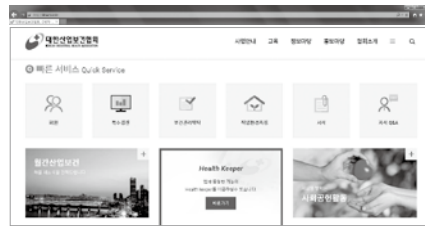
반응형 홈페이지 화면

A 2015년 인터넷 이용실태조사에 따르면 가구별 인터넷 접속률이 100%에 이르렀습니다. 모든 국민이 인터넷을 사용하고 있습니다. 인터넷을 접속하는 방법은 변화하고 있습니다. 주변을 봐도 스마트폰을 이용해 인터넷을 접속하는 사람들이 점점 많아지고 있습니다. 이러한 변화에 발맞추어 개발된 기술이 '반응형 홈페이지'입니다.