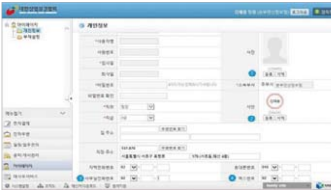
<그림 2>개인정보 설정화면

아래의 <그림 2>는 그룹웨어를 사용하면서 기본적으로 확인해야 할 설정사항으로 접속한 사용자 개인의 기본정보를 가지고 있다. 먼저 이 정보가 본인의 정보가 맞는지 확인하고 잘못된 사항은 미리 정확하게 수정해서 사용하는데 문제가 생기지 않도록 하자.