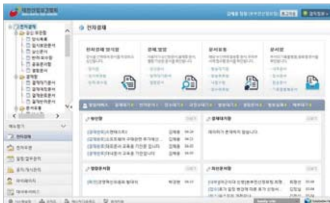
〈그림 1〉그룹웨어 접속화면 예시

〈그림1〉은 전자결재 시스템에 접속한 화면의 예시이다. 왼쪽에는 메뉴들이 그룹별로 나열되어 있고 오른쪽에는 접속한 사용자에게 필요한 정보를 요약해서 볼 수 있도록 배치되어 있다. 전자결재에 필요한 문서의 알림 및 주요 문서함의 최근목록을 볼 수 있다.