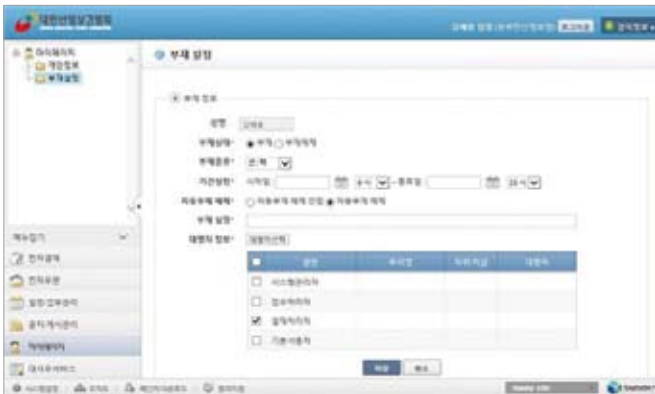
〈그림 3〉부재설정 화면

부재설정은 본인이 병가, 휴가, 휴직 등의 사유로 부재 시 본인이 등록해서 일정한 업무를 지정한 직원이 대행을 할 수 있도록 설정하는 기능을 제공한다.