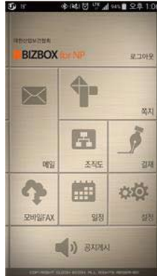
<그림 5> 로그인 후 메뉴