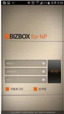
<그림 4> 로그인 화면