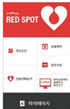
① 헌혈카페 찾기