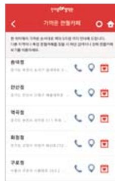
가까운 헌혈카페 조회