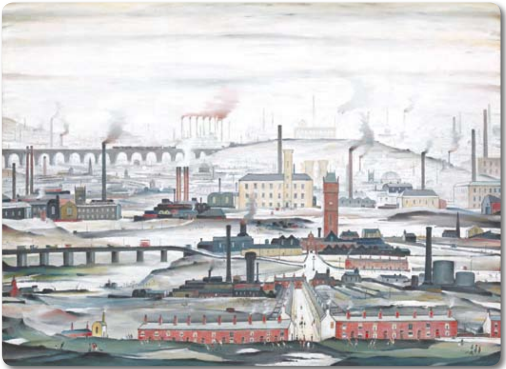
Industrial Landscape (1955), Oil paint on canvas, 114,3*152,4 (cm)

작하였다. 당시 전통적인 미술기법을 10년 가량 공부하고, 그 후 10년 동안 켈퍼드미술대학에서 공부하였다. 그가 산업화된 도시의 풍경을 그리기 시작한 것은 1917년, 그의 나이 30세에 이르러서였다. 그는 영국 북부의 공장지대에서 소외되어 있는 노동자들을 주된 소재로 묵묵히 그림을 그려나갔다. 그리고 그는 아무도 알아주지 않는 20여 년간의 기간 동안 꾸준히 그의 작품세계를 이어나갔다. 2)